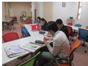
職場・上級学校見学 (5月・10月)