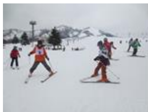
スキー教室 (1月/年次)