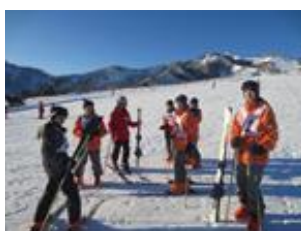
スキー教室 (1月 / 1年次)