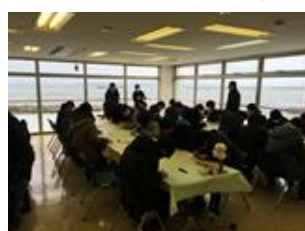
校外研修 (1月 / 2年次)