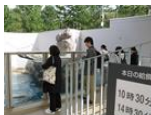
校外研修 (10月 / 3年次)