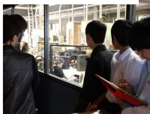
職場・上級学校見学 (5月・10月)