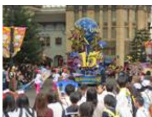
修学旅行 (10月 / 2年次)