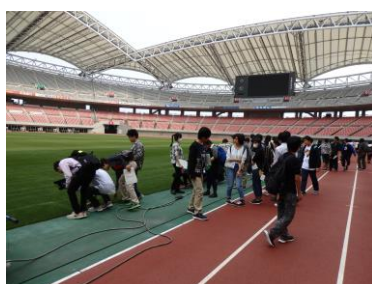
校外研修 (5月 / 1年次)